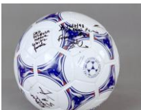
Coupe du monde 1998 Ballon du 3 e but