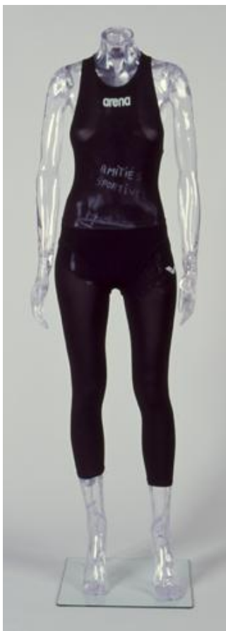
Laure Manaudou, Combinaison Arena, 2004

Le polyuréthane est une autre matière que les équipementiers ont essayé d'introduire dans les combinaisons de natation. Camille Muffat, par exemple, a utilisé dans les années 2008