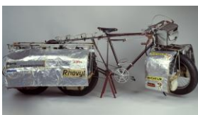
Jean Naud Tricyclette du désert, 1986

Le défi est l'acte qui fonde l'exploit sportif, il a donc été choisi comme concept de base du Musée National du Sport et comme fil rouge pour la présentation des collections. Être plus fort, aller plus loin, courir plus vite, sauter plus haut, pour battre sa meilleure performance ou son concurrent. Chaque sportif se fixe des objectifs et des défis pour atteindre le sommet. La victoire n'est jamais le fruit du hasard. Elle est toujours le résultat d'une extraordinaire rencontre entre un entraînement physique long et régulier, une préparation psychologique rigoureuse et des conditions extérieures parfois aléatoires.