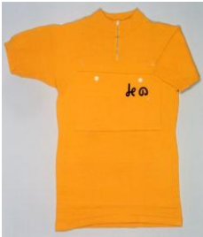
Jacques Anquetil Maillot jaune, 1961