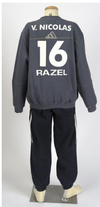
Valérie Nicolas Sweat-shirt, 2003

Valérie Nicolas (née en 1975) a un palmarès très impressionnant, au point d'être considérée comme l'une des meilleures joueuses de handball de tous les temps. En 1999, elle reçoit l'argent au championnat du monde en Norvège. Avec son équipe, elle obtient deux fois le bronze en championnat d'Europe et deux fois l'or aux Jeux Méditerranéens. En 2007 elle est élue meilleure gardienne du Championnat du monde pour la deuxième fois de sa carrière.