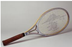
Yannick Noah Raquette, 1983