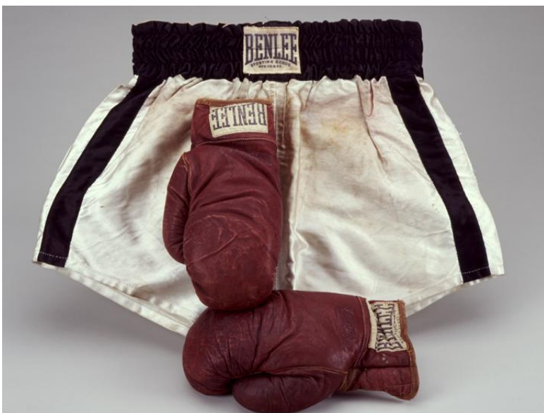
Marcel Cerdan Short et gants, années 1940

David Douillet//Shinichi Shinohara en judo