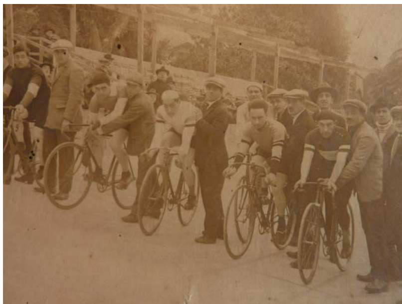
Départ de course au vélodrome du Pont Magnan.

L'activité vélocipédique niçoise a battu au rythme des vélodromes de la Place Arson puis du Vallon des Fleurs, de Chambrun, de Magnan, de Pasteur et du Palais des Expositions de 1890 à 1963. De tous ces vélodromes, celui de Magnan en est le fleuron.