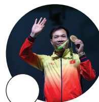
Hoàng Xuân Vinh