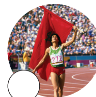
Nawal El Moutawakel