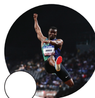
Hugues Fabrice Zango